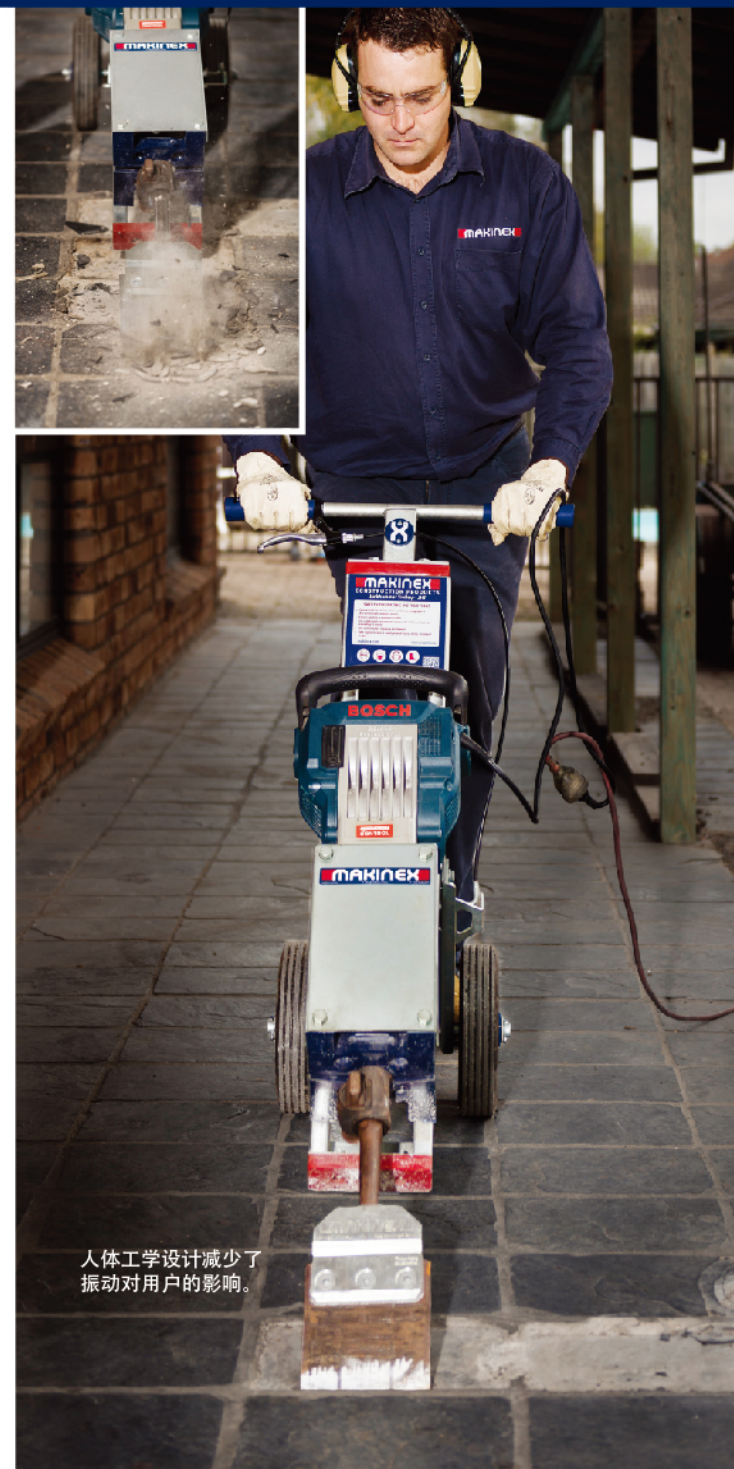
人体工学设计减少了振动对用户的影响。