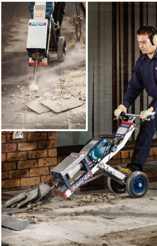
可调姿势范围为20-80度，适用于大多数的破拆工作。

MAKINEX破拆钻推车是一款多用途破拆工具，可去除地砖、拼花地板和砂浆层。它还可以通过去除瓷砖位残余和混凝土地板来制备表面。